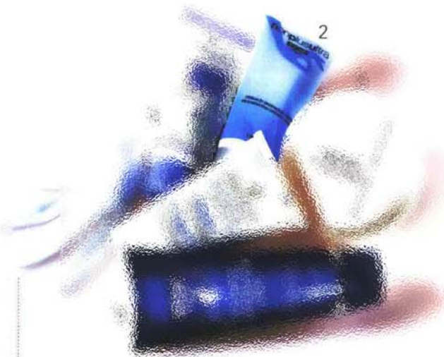
2 Trattamento anti-age con guanti di cotone Nonplusultra VANIMLINE.