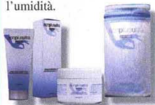
Le confezioni della Crema Giovinezza Mani Nonplusultra di Vanity Line.

La Crema Giovinezza Mani Nonplusultra di Vanity Line è una emulsione setosa e morbida dall'elevato potere restitutivo, idratante, ridensificante e schiarente. Grazie alla sua formula particolare a base anche di cacao e vitamina E, questa crema ha anche una elevata azione protettiva ed evita che le mani si screpolino o si arrossino a causa del vento freddo o dell'umidità.